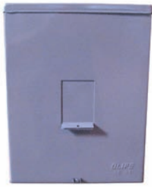
CÓDIGO 5001037 CAIXA CGN P/ DISJUNTOR 200A