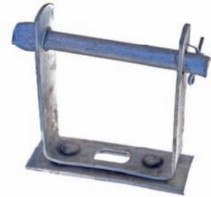
CÓDIGO 1002058 REX 1 X 1 - 1/8 S/ ROLDANA 1002059 REX 1 X 1 - 3/16 S/ ROLDANA 1002079 REX 1 X 1 - 3/16 GALV. A FOGO S/ ROLDANA