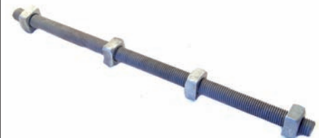
CÓDIGO 1002077 5/8X 7 16X150mm 1002043 5/8X 8 16X200mm 1002044 5/8X 9 16X225mm 1002074 5/8X10 16X250mm 1002046 5/8X12 16X300mm 1002045 5/8X14 16X350mm 1002047 5/8X16 16X400mm 1002048 5/8X18 16X450mm 1002049 5/8X20 16X500mm 1002050 5/8X22 16X550mm 1002097 5/8X24 16X600mm