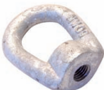
CÓDIGO 1002057 PORCA OLHAL M-16