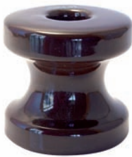
CÓDIGO 3602006 ROLDANA 72X72 P/ REX