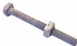
CÓDIGO 1002032 5/8x 2 16x 50mm 1002073 5/8x 3 16x 75mm 1002033 5/8x 4 16x100mm 1002034 5/8x 5 16x125mm 1002035 5/8x 6 16x150mm 1002036 5/8x 7 16x180mm 1002037 5/8x 8 16x200mm 1002038 5/8x 9 16x225mm 1002039 5/8x10 16x250mm 1002040 5/8x12 16x300mm 1002041 5/8x14 16x350mm 1002042 5/8x16 16x400mm