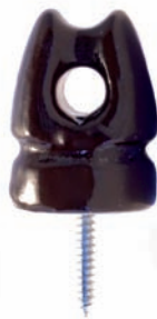
CÓDIGO 3602005 ISOLADOR OLHAL TIPO PIMENTÃO