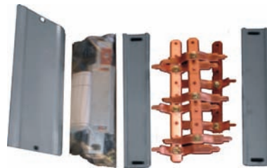
CÓDIGO 5001017 KIT BARRAMENTO (03 A 08 MEDIÇÕES) CURTO 5001018 KIT BARRAMENTO (09 A 12 MEDIÇÕES) MÉDIO 5001019 KIT BARRAMENTO (15 A 18 MEDIÇÕES) LONGO