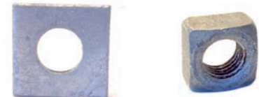
CÓDIGO 1002008 ARRUELA QUADRADA 1002072 PORCA QUADRADA M-16x24x13mm